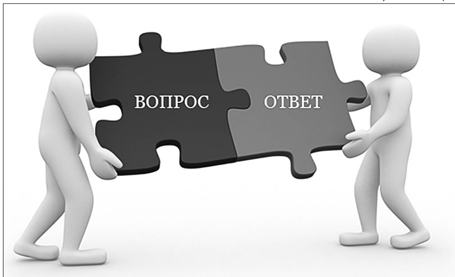
Рисунок из сети интернет